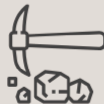
GRÁFICO DE REGALÍAS POR AÑO