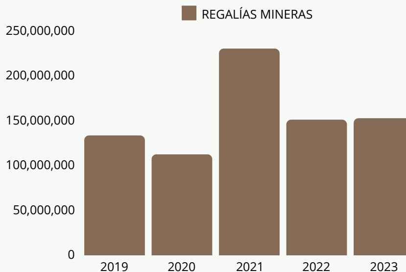
GRÁFICO DE REGALIAS POR AÑO