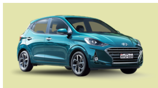
HYUNDAI Modelo GRAND I10 28 Unidades