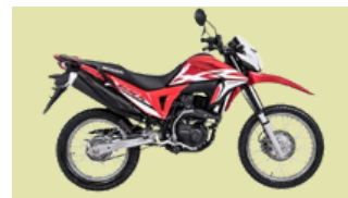
HONDA Modelo XR190L 58 Unidades