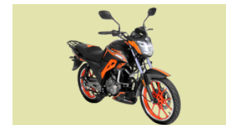
RONCO Modelo PANTERA 200R 28 Unidades