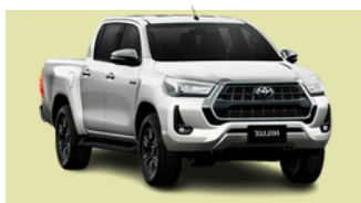
TOYOTA Modelo HILUX 29 Unidades