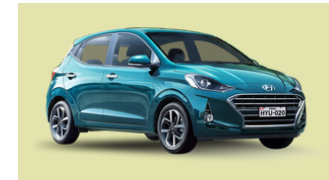
HYUNDAI GRAND I10 20 Unidades