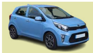
KIA Modelo PICANTO 57 Unidades