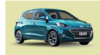
HYUNDAI GRAND I10 25 Unidades