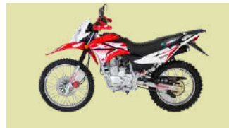
X-PLORER 200RR 29 Unidades