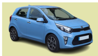
KIA Modelo PICANTO 26 Unidades