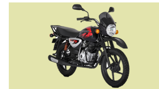
BAJAJ BOXER BM 150X UG 12 Unidades