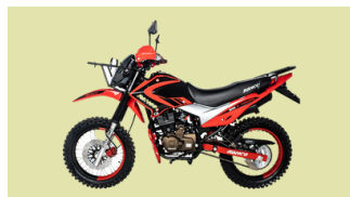
RONCO Modelo X-TREMO-C 200 29 Unidades