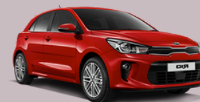
KIA Modelo PICANTO 34 Unidades