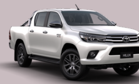
TOYOTA Modelo HILUX 41 Unidades