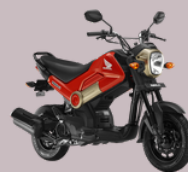
HYUNDAI Modelo NAVI 44 Unidades