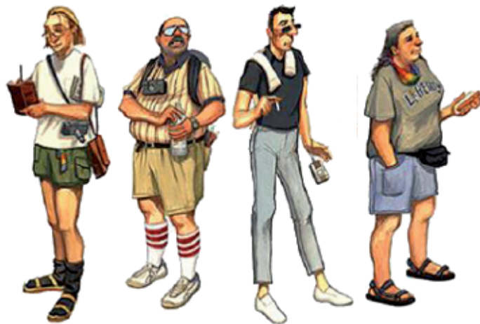
GASTO DEL TURISMO INTERNACIONAL US$ BILLONES

Entre los mercados con mayor gasto, los que mostraron esta tendencia al crecimiento con mejor desempeño fueron: Japón (8%), Canadá (5%) y los Países Bajos (4%). Además, cabe resaltar el considerable crecimiento de Brasil (65%) y de la República de Corea (60%). Por otro lado, países del Lejano y Medio Este mostraron también crecimientos de dos dígitos: Israel (29%), Taiwán (26%), Indonesia (25%), Turquía (18%), Malasia (16%), Australia (14%), Singapur (11%) y Hong Kong (10%).